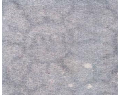
TI 3 Rayado Perpendicular